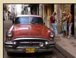
"CUBA" 25' (A. Gómez)