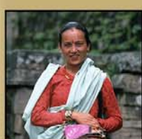
"NEPAL" 14' (M. Aretxabala - R. Cerrato)