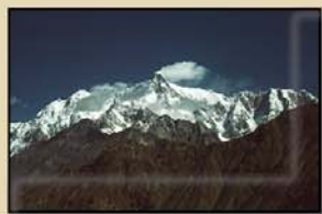
"LA RUTA DE LA SEDA" 20' (J. Santaren)