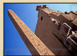
"EGIPTO" 16' (R. Ruiz)