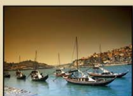
"PORTUGAL" 21' (R. Ruiz)