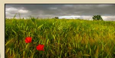
"LIBRE" 16' (Colectivo BIHOTZ)