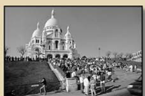
"PARÍS" 15' (C. Barco)