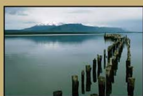
"CHILE Y ARGENTINA" 24' (R. Cerrato - C. Barco)