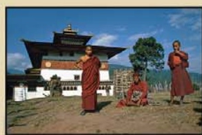
"BHUTAN" 24' (R. Cerrato - C. Barco)