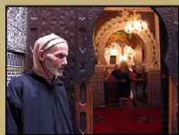
"MARRUECOS" 16' (A. Gómez)